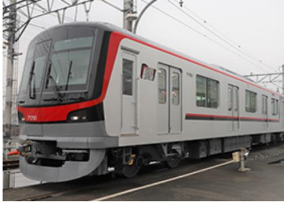
▲ T Hライナー用車両「70090型」